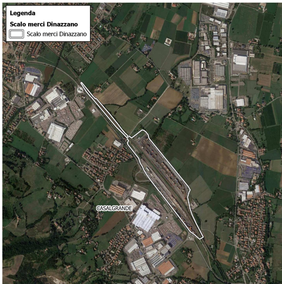
Scalo di Dinazzano