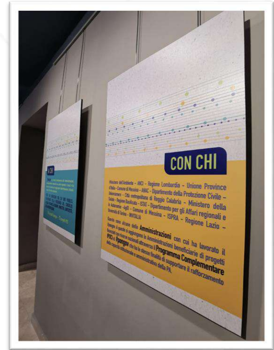
19 marzo 2024 #pongovexpo – Percorsi di innovazione e coesione