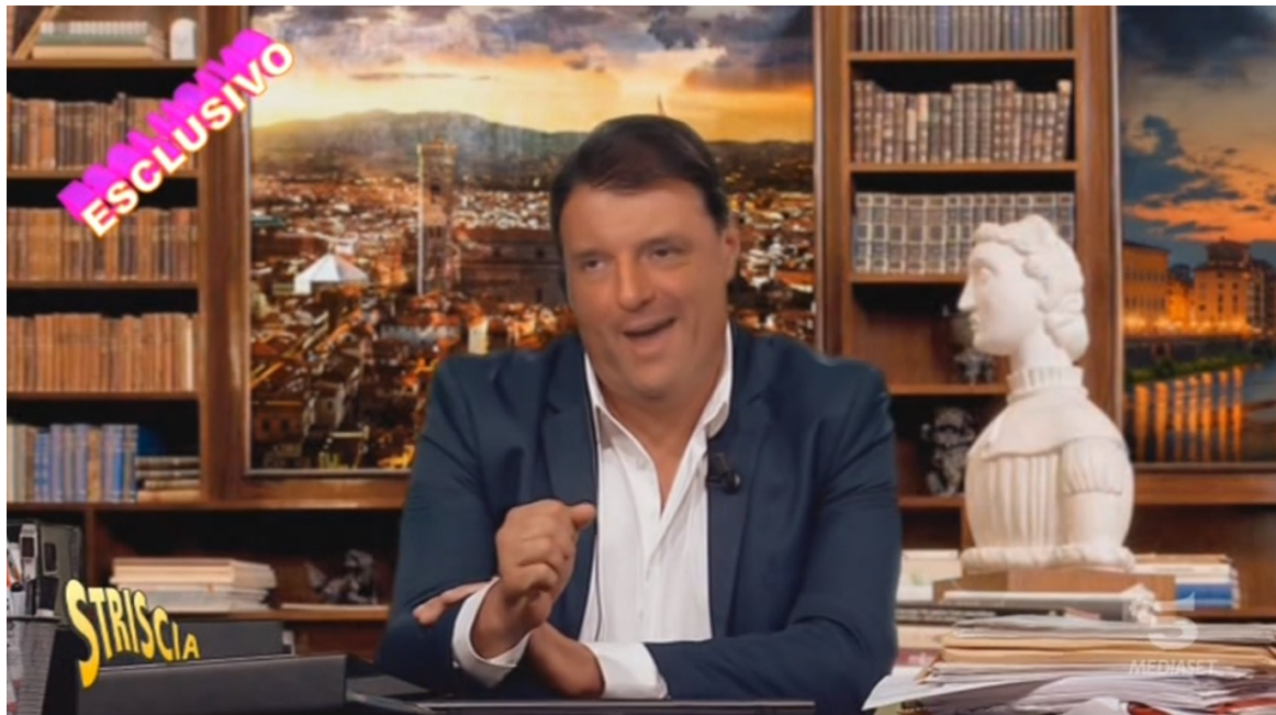
Striscia la Notizia – Settembre 2019