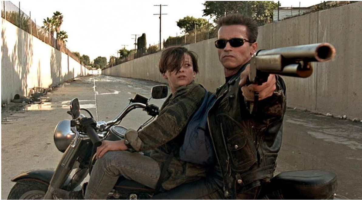
Terminator 2 – 1991