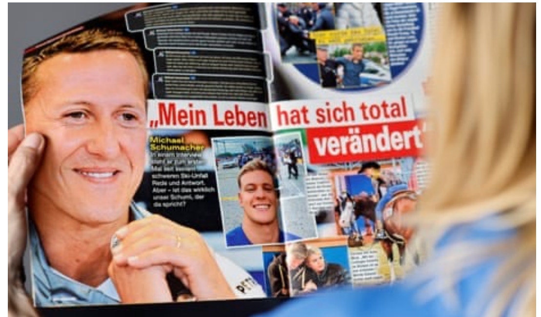
Die Aktuelle – Aprile 2023