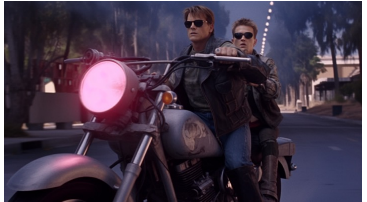
Terminator con Midjourney – 2023